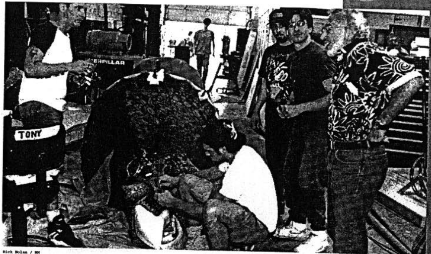
Rick Moran / MM

TA: You bet! We (Team Tony d'Amato, ed.) did a big thing last year for Volkswagen in Wolfsburg, Germany. We had approximate 250 new, shining red Jetta sports models on a parking lot in front of international audience. The whole number of cars first had to vanish, then the audience would arrive, expecting a big show with fireworks. A long silence, nothing is happening. Then, suddenly, out of nowhere 250 beautiful sports cars appear on the empty lot. It was really a lot along the lines of the